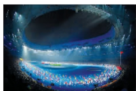
《我的跑道》,你心中的跑道