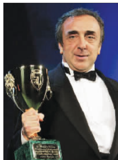
52岁的最佳男主角西尔维奥·奥兰多