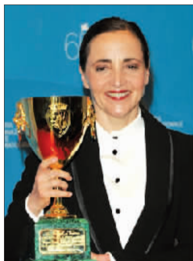
51岁的最佳女主角多米尼克·布兰克