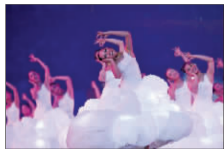
320位聋人姑娘对着星星许愿