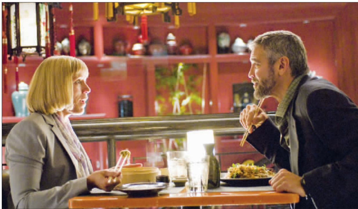
尽管威尼斯电影节邀来科恩兄弟的新片《阅后即焚》作为开幕电影,却因为参赛片整体成色不佳,始终无法逃脱影评人对本届电影节参赛片的口诛笔伐

急败坏”的口吻为电影节参赛片下了一个定论。不买账的不止《卫报》一家,连意大利的本土媒体也没有给马可·穆勒留一点薄面,意大利《晚邮报》的评论称:“太多的影片令人失望,今年真正云集好莱坞明星的影片太少,影院观众和相关派对也都明显减少。”而《新闻报》资深影评人利耶塔·托尔纳博尼的惊呼几乎应和了《卫报》的观点:“今年的电影节真是灾难。没什么好电影,在我看过的影片中,我喜欢的只有科