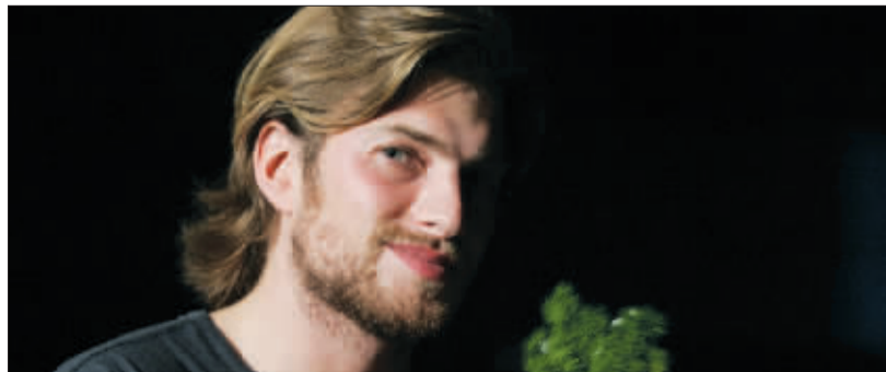
曾被瑞典媒体评为“最性感男人”的安德鲁斯·威尔逊第一次来上海