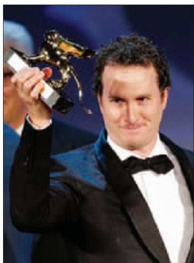
达伦·阿伦诺夫斯基凭《摔跤手》夺得金狮奖

除了《泰莎》、意大利导演马可·贝奇斯的《看鸟人》、日本导演北野武的《阿基里斯与龟》以及宫崎骏《悬崖上的金鱼公主》等少数几部影片受到好评之外,其他大部分电影都让挑剔的影评人大失所望。“今年大部分的参赛影片就像没加糖的白粥。”英国《卫报》影评人安德鲁·普尔弗在电影节落幕前就已经按捺不住自己失望的情绪,几乎以一种“气